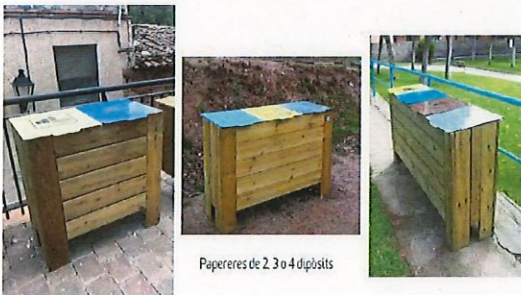
Papereres de 2, 3 o 4 dipòsits

Disposem d'un model per a contenidors de: 120, 240 i 360 litres.