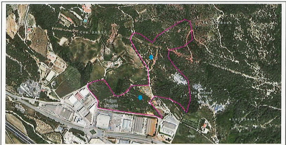
Figura 2. Delimitació aproximada de la finca municipal de Can Roca.